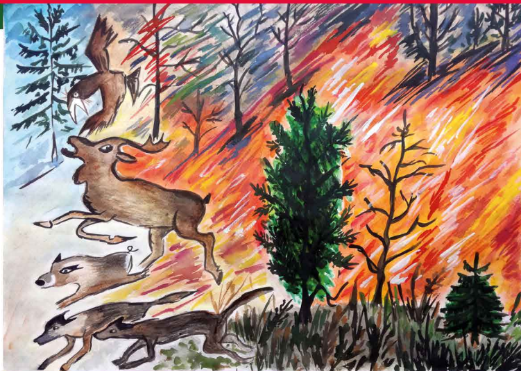
Автор: Иваница Колева – ШИИ "Живопис", гр. Казанлък Международен конкурс за детска рисунка, "С очите си видях бедата"

Пазете дрехите си от запалване, особено ако са от изкуствена материя. Ако се запалят, легнете на земята и се търкаляйте.