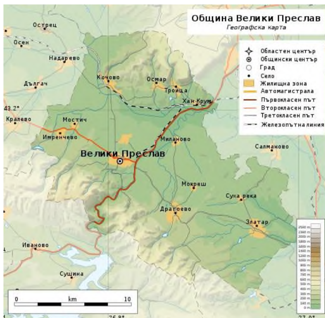
Фигура 2: Карта на община Велики Преслав