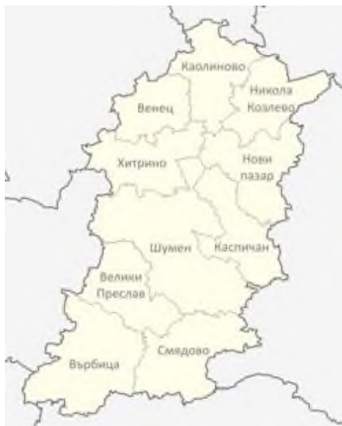
Фигура 1: Карта на област Шумен

Община Велики Преслав граничи на североизток с община Шумен, на северозапад с община Търговище, на югоизток с община Смядово, а на югозапад с община Върбица.